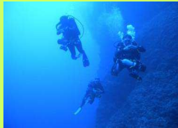
Murènes à 65 m au Nikon P 60 Faille d'Arue à 60 m au trimix 19 % O 2 et 30 % hélium